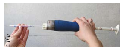
Utilisation des tubes physico-chimiques pour la détermination de la concentration en polluant